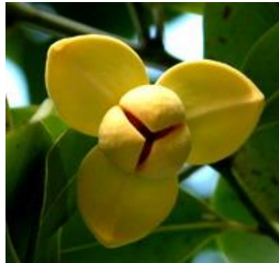
ดอกคำตวนสัญลักษณ์ของผู้สูงอายุ