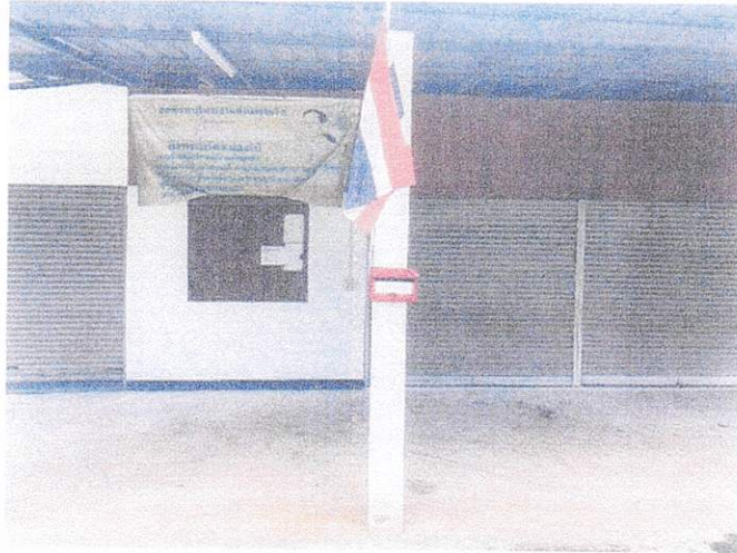
ศาลาอเนกประสงค์ หมู่ ๕ บ้านหนองไผ่