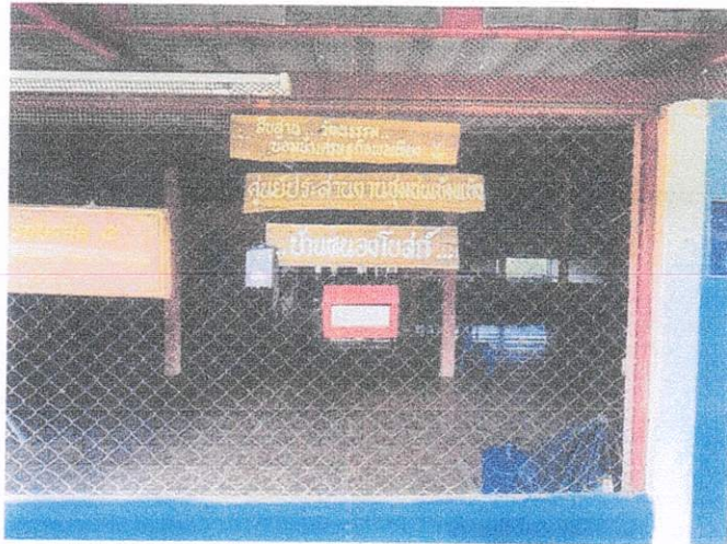
ศาลาที่ทำการกองทุนหมู่บ้าน หมู่ ๗ บ้านหนองโสน