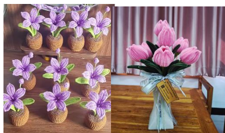
กระถางดอกไม้