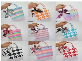
กระเป๋าสานพลาสติก