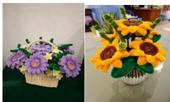
ดอกไม้จากลวดกำมะหยี่