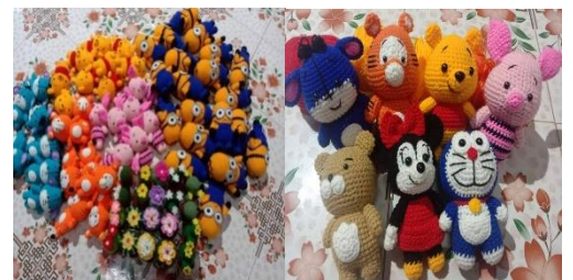
พวงกุญแจตุ๊กตา